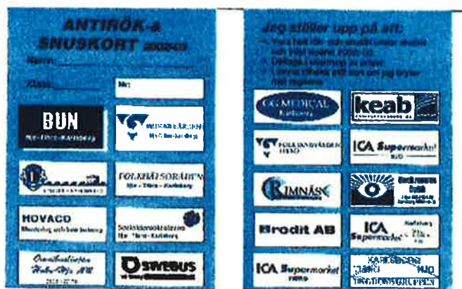
Så här såg antirök- och snuskortet ut år 02-03

Barn och ungdomars hälsa är viktig tycker vi och antirök- och snuskortet är en del av det folkhälsoarbete som bedrivs i kommunen.