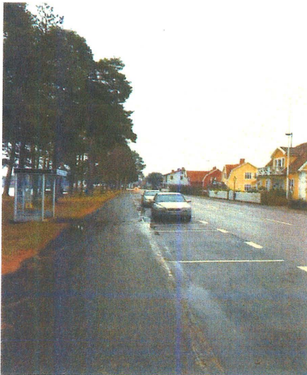
27:e November kl: 14

Med ny belysning på denna sträckan skulle det också vara möjligt att utrusta några stolpar med spotlights som lyser upp grenverket i några tallar. En stolpe skulle kunna placeras vid busshållplatsen så blir även denna upplyst.