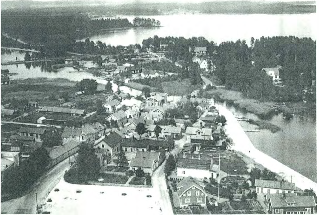
OVAN: Flygbild över Rödösund, ca 1935.

Undenäs). De flesta av dagens odlingsmarker har varit i bruk sedan medeltiden. Större gårdar inom kommunen är Sannum, Forsvik, Bocksjö och Gällsebo. Beroende på naturlandskapet varierar också byarnas utformning. De medeltida byarna var placerade i Undenäs, Mölltorp och Brevik. Skiftesreformerna som genomfördes under slutet på 1700-talet och början av 1800-talet innebar utlokalisering av gårdar från de sammanhållna byarna.