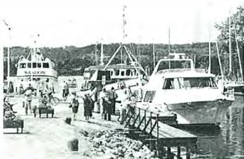
OVAN: Göta kanal vid Rödesund i Karlsborg.

Utgångspunkten för den nya översiktsplanen för Karlsborgs kommun är kommunens Vision 2020 . Den pekar ut fyra prioriterade insatsområden; Leva och bo, Kommunikationer, Upplevelser och Karlsborgs centrum. Översiktsplanen är utformad för att 1. redovisa hur hänsyn tas till riksintressen, förordningar och övriga planeringsförutsättningar 2. redogöra för hur den övergripande planeringen samordnas samt 3. redovisa delprojekt och nyckelprojekt som kan påbörja och driva utvecklingen av kommunen för att nå visionens mål. I denna sammanfattning redovisas övergripande principer (återfinns även mer i detalj på sidan 40-41) som utgör den samlade strategin för översiktsplanen samt de delprojekt som är identifierade (redovisas även på sidorna 104-125).