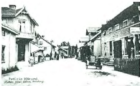
NEDAN: Parti från Rödeshund