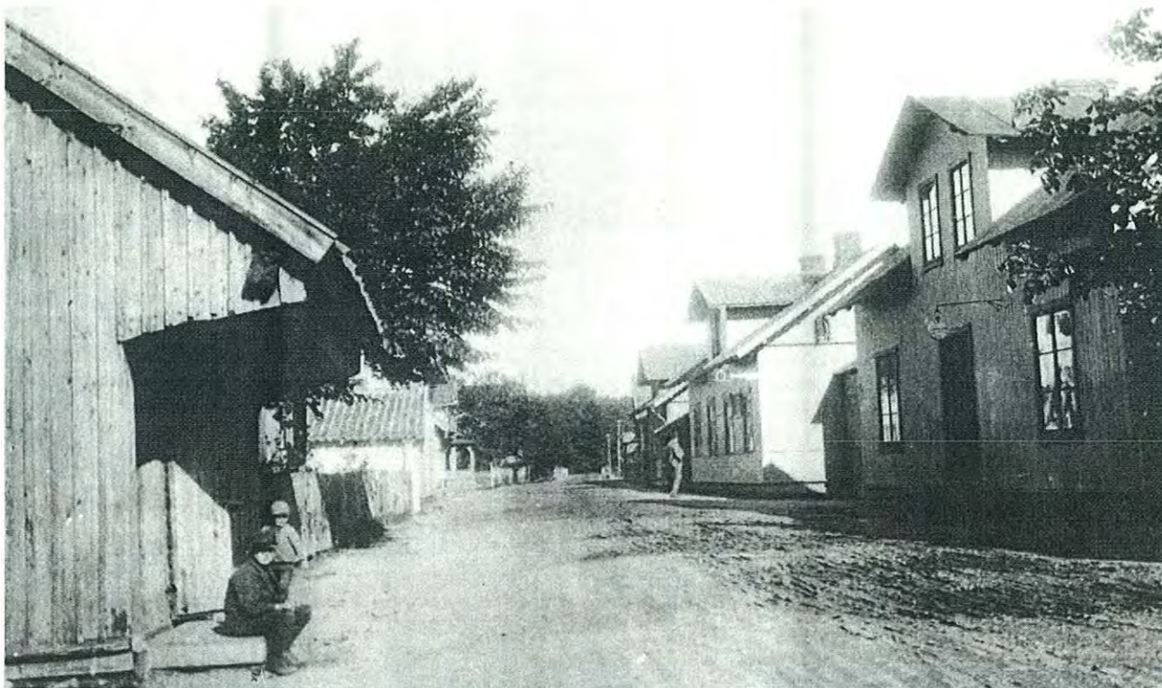
OVAN: Storgatan genom Rödeshund, 1880-tal. Den sista marknadsboden (t v) revs 1902.