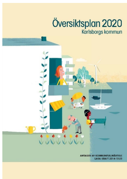
Figur 2 Gällande översiktsplan, Översiktsplan 2020, antagen 2014.

Översiktsplan 2020 är gällande för Karlsborgs kommun. Den är antagen 23 september 2014 och aktualiserades 2021-02-22. Till översiktsplanen hör Länsstyrelsens granskningsyttrande daterat 25 april 2014.