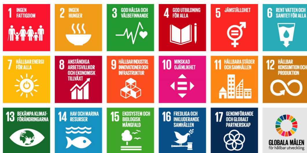
Figur 3 De 17 globala målen.

Den 25 september 2015 antog FN:s generalförsamling resolutionen Att förändra vår värld: Agenda 2030 för hållbar utveckling , med 17 globala mål som spänner över en bredd av samhällsutmaningar. De 17 globala målen har i sin tur 169 delmål och 230 indikatorer. Under en 15-årsperiod, med start 1 januari 2016 och fram till år 2030, har världens länder förbundit sig att tillsammans jobba för att uppnå de globala målen och en långsiktigt hållbar utveckling. Agenda 2030 ersätter Agenda 21 som antogs 1992.